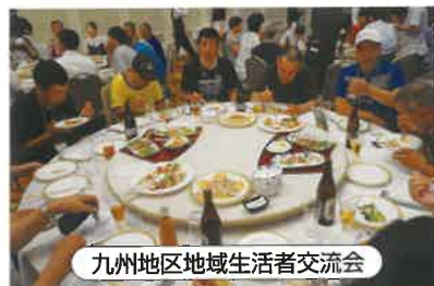
九州地区地域生活者交流会

・ご利用者が地域において自立した生活ができるよう、住居の確保、その他地域における生活に移行するための活動に関する支援を行います。