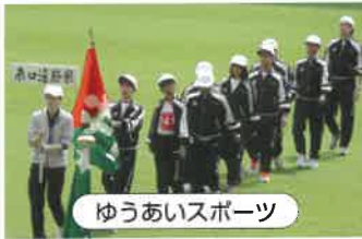
ゆうあいスポーツ